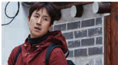
LEE Sunkyun dans le rôle de Munsu